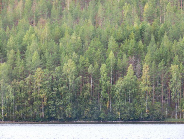
Kuva 1. Lajunvirran länsirannan kallioista rinnemetsää. Kuva Selkäsaaren kohdalta.