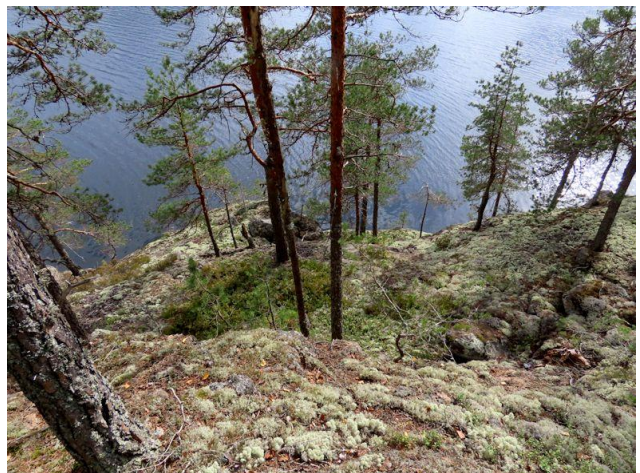
Kuva 6. Länsirannan CIT-männikköä Nuottasaaren pohjoispäässä.