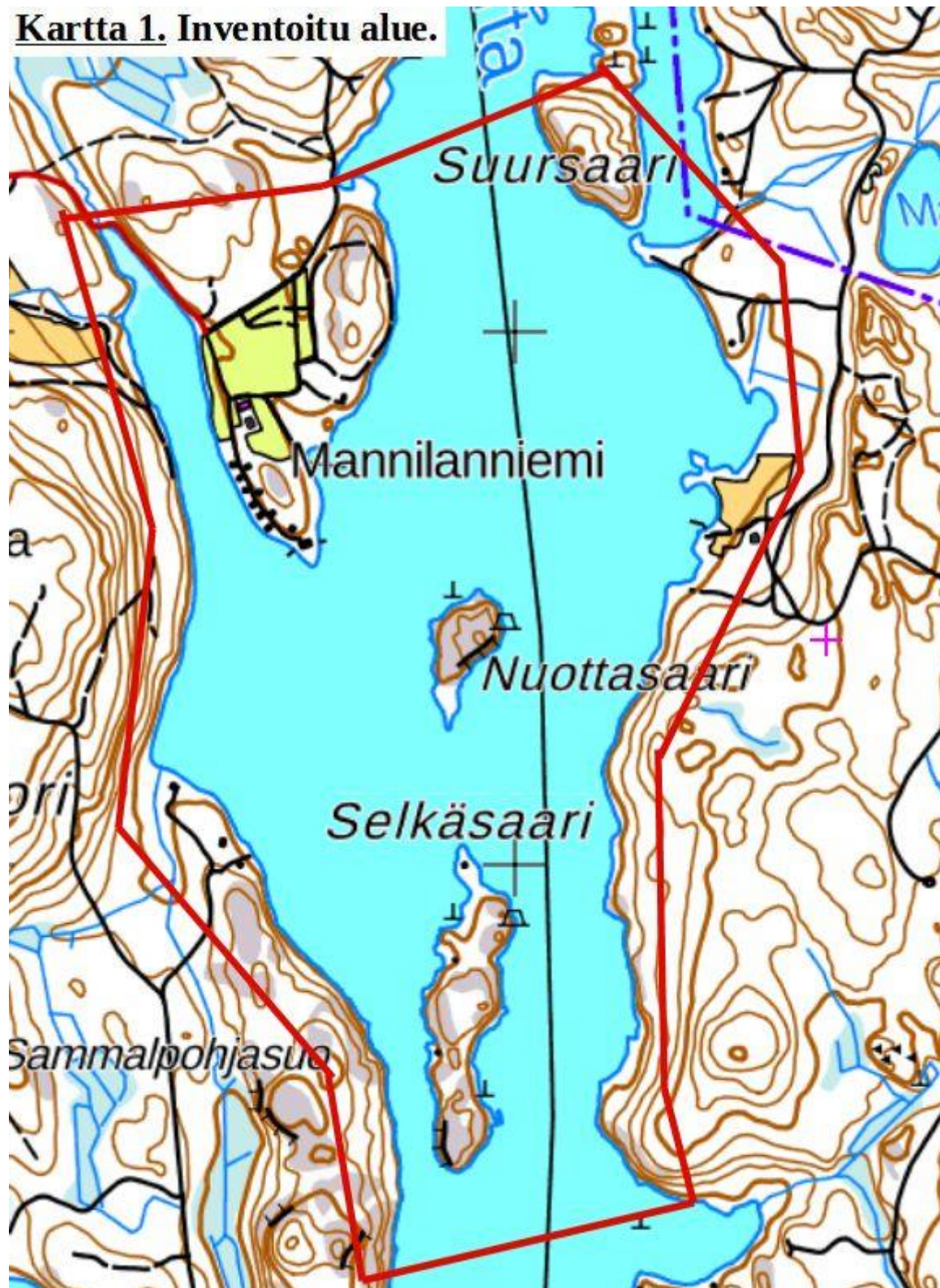
Kartta 1. Inventoitu alue.