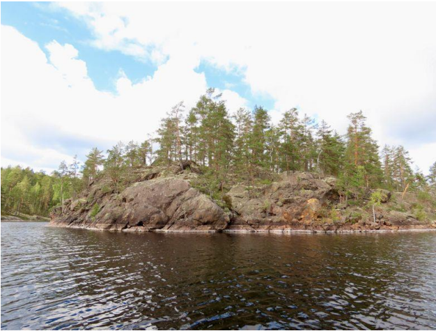
Kuva 7. Selkäsaaren eteläpää.