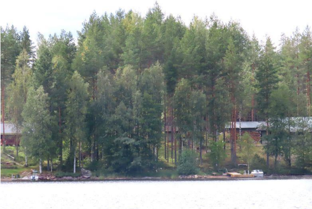
Kuva 9. Kuvassa Mannilaniemen länsirannan lomamökkejä ja venerantaa.