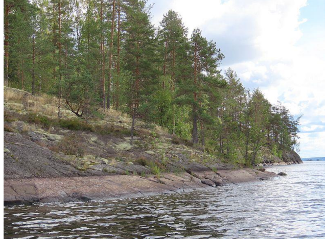
Kuva 4. Selkäsaaren länsirantaa etelään päin kuvattuna.