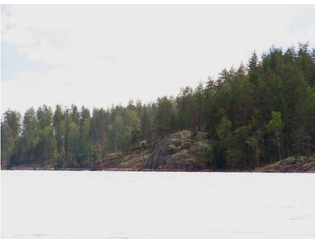
Kuva 11. Lajunvirran länsiranta on eteläosistaan kalliainen. Kuva Selkäsaaren eteläpuolelta.