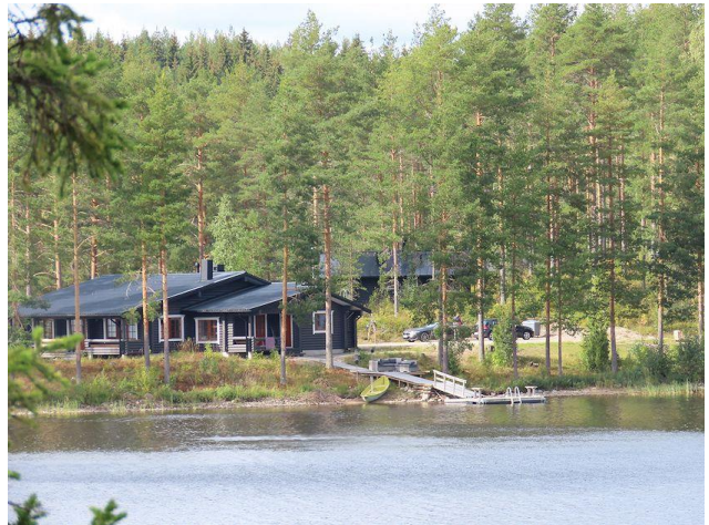
Kuva 10. Mannilanniemen rakennettua itärantaa. Kuvassa lomakylän päärakennus.