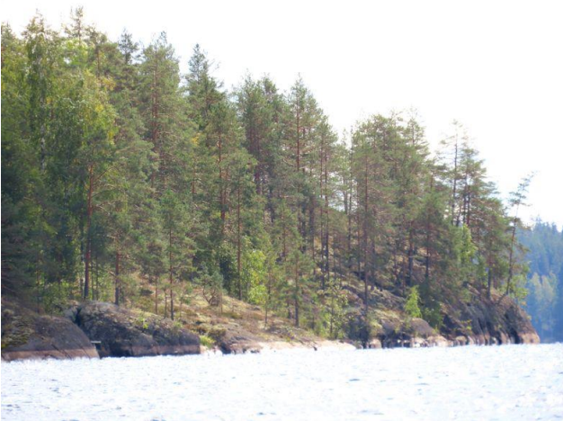
Kuva 3. Nuottasaaren pohjoispää idästä kuvattuna