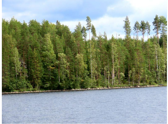
Kuva 2. Lajunvirran loivaa itärantaa Nuottasaaren ja Selkäsaaren kohdalta.