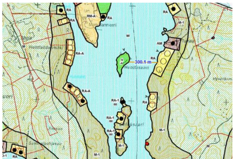
KUVA 14. Alueen kaavatilanne

rakennuspaikoista on osoitettu ranta- asemakaavassa (länsipuoli) ja osa yleiskaavassa. Nuottasaaren itäpuolen mantereella on kaavassa osoitettu kolme rakentamatonta lomarakennuspaikkaa. Ne vaikuttavat maastotietoaineiston perusteella olevan edelleen rakentamattomia. Ne sijaitsevat lähimmillään noin 300 metrin etäisyydellä Nuottasaaren rannasta. Rakentamattomien rakennuspaikkojen pohjoispuolella on osoitettu maatilaa merkinnällä AM.