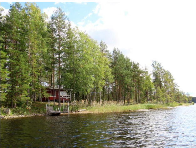
Kuva 5. Nuottasaaren länsirantaa etelään päin kuvattuna. Kuvassa nähtävissä saaren loma-asunto.