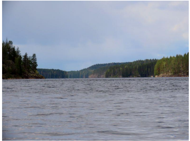
Kuva 8. Kuva Nuottasaaren pohjoispäästä pohjoiseen. Taustalla Suursaaren rantakalliot.